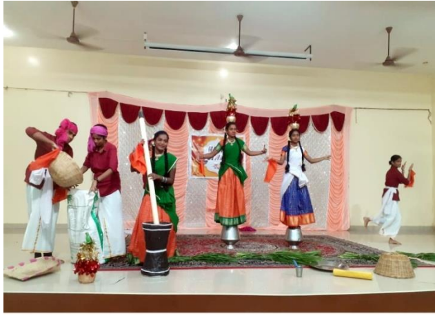
Traditional Dance - RMSD