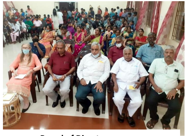
Board of Directors