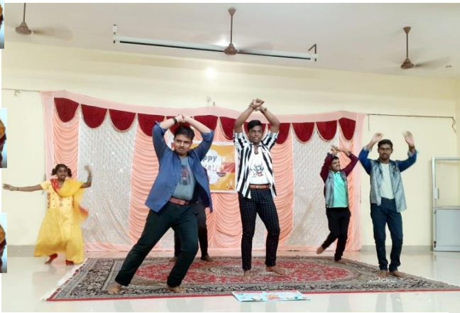
Folk Dance - IDPC