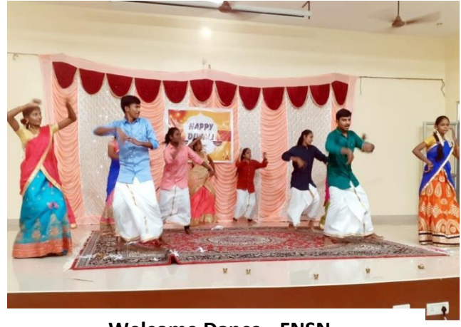
Welcome Dance - FNSN